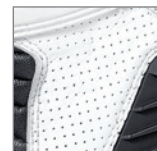
Elementi in pelle traforata